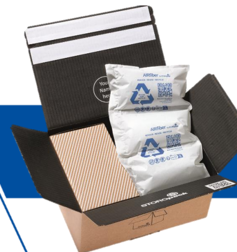
Fissaggio e Protezione