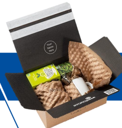
Fissaggio e Protezione